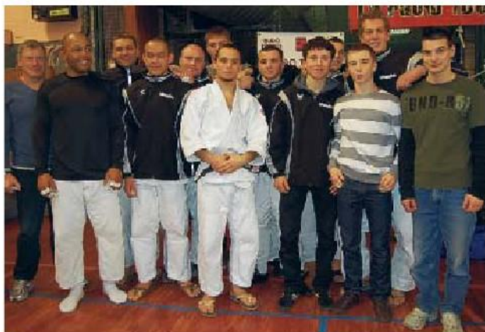
L'équipe B de l'IGW au pied du podium