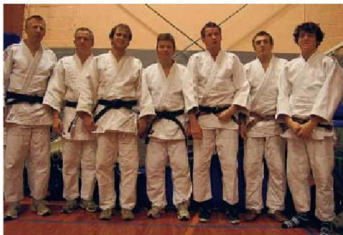
Objectif atteint pour Grez-Doiceau

L'équipe de Grez-Doiceau, promue de D4 a largement atteint ses objectifs en parvenant à se maintenir en D3. Les Gréziens terminent sixièmes, sur les talons de Rebecq (5 e avec 7 victoires en 11 rencontres) et juste devant Dion-Valmont (8 e avec 5 victoires en 11 rencontres). C'est l'équipe B de la Chênaie, invaincue dans ce championnat, qui décroche le titre et la montée en Division 2.